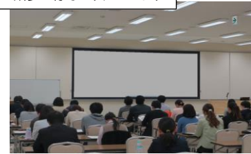
研修の様子（イメージ）

著書に『ボランティア・コーディネーター ～その理論と実際』（大阪ボランティア協会）、『コミュニティソーシャルワーク』（ミネルヴァ書房）、『なぜ、ボランティアか？ 思いを生かすNPOの人づくり戦略』（海象社・共訳）、『ボランティアコーディネーションカ ～市民の社会参加を支えるチカラ』（中央法規出版、共著）などがあります。